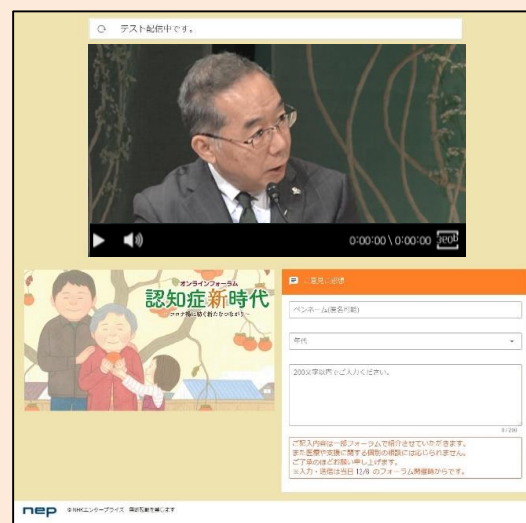
▲配信サイトイメージ(パソコン版) ※画面は開発中のものです

※当日の開演時間(12月6日午後3時00分)になりましたら自動的にフォーラムのライブ配信が開始されます。